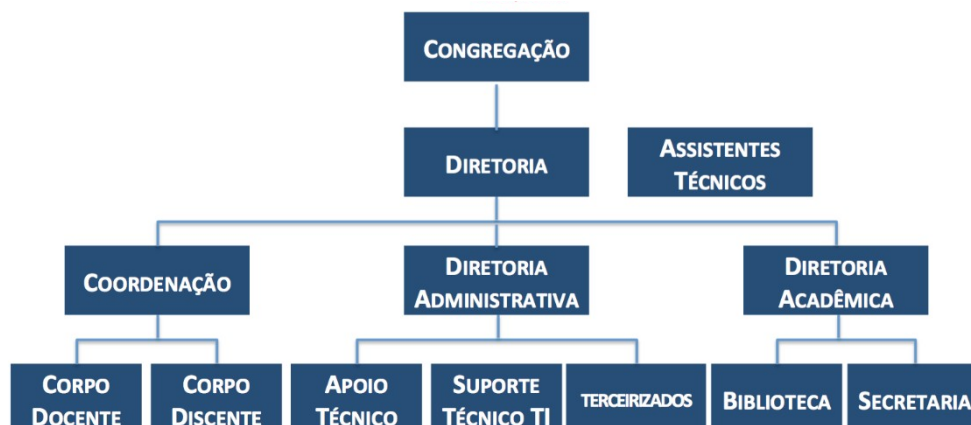
Figura 2: Organograma padrão da Fatec Ribeirão Preto

A avaliação institucional da Unidade é realizada anualmente através do WebSAI, um questionário eletrônico respondido por alunos, professores e funcionários, que visa acompanhar a evolução das atividades acadêmicas, observar o atendimento às expectativas e também acompanhar o crescimento da infraestrutura física.